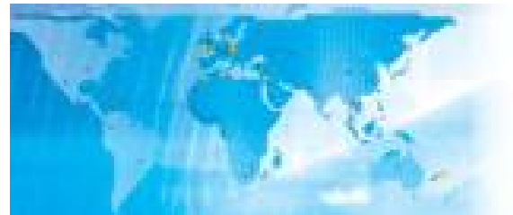
Interventions dans 110 pays - filiales dans 8 pays

Tibco retail représente 15% du CA Entreprises